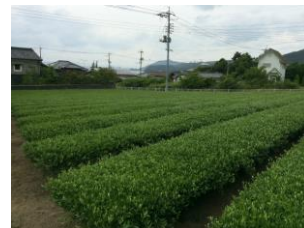
自社農園にて丹精込めて栽培されたオリーブ